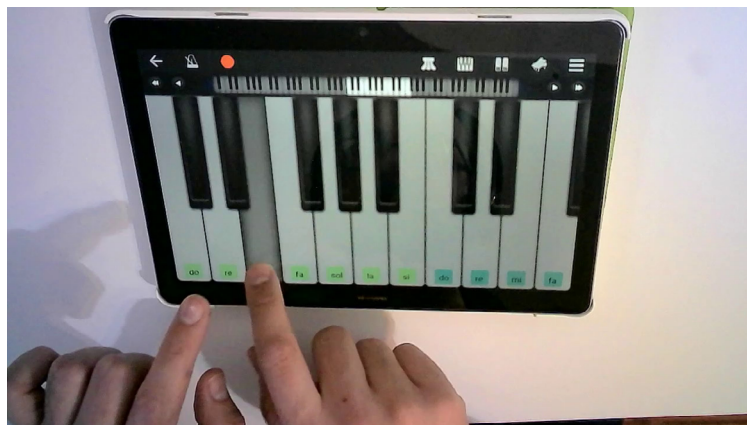
Aplicación digital WalkBand

En este paso es donde está la miga, pues el alumno tendrá que trabajar en solitario y a su ritmo sobre el tutorial de la parte elegida en el paso anterior. Se facilita al alumno una rúbrica de autoevaluación para que pueda valorar su propio trabajo.