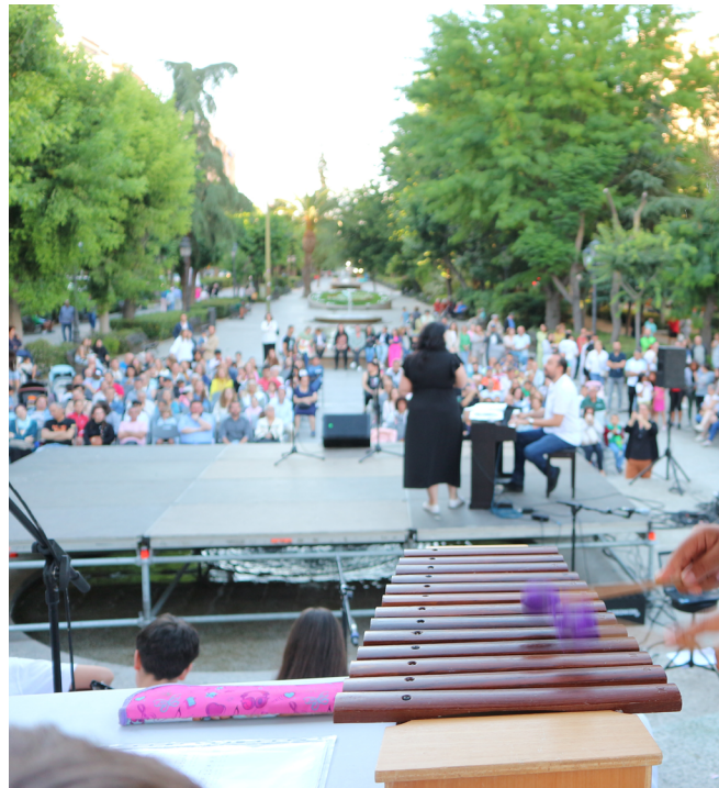
• Vista del público desde la posición del xilófono.

Abordar el trabajo y estudio de un nuevo repertorio con los estudiantes es mucho más entretenido para el discente y enriquecedor para el docente. Hacer comunidad haciendo música es una experiencia transformadora, que da sentido inmediato a los aprendizajes a través de la práctica y los conciertos públicos. Publicar los materiales creados a través de REAs permite a los docentes compartir conocimiento de forma accesible, fomentar la colaboración entre educadores y enriquecer el aprendizaje al ofrecer recursos adaptables y reutilizables para distintos contextos educativos.