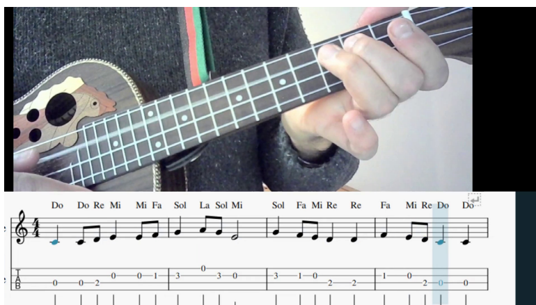
Imagen de un videotutorial de ukelele