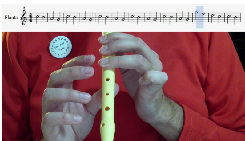
Imagen de un videotutorial de flauta