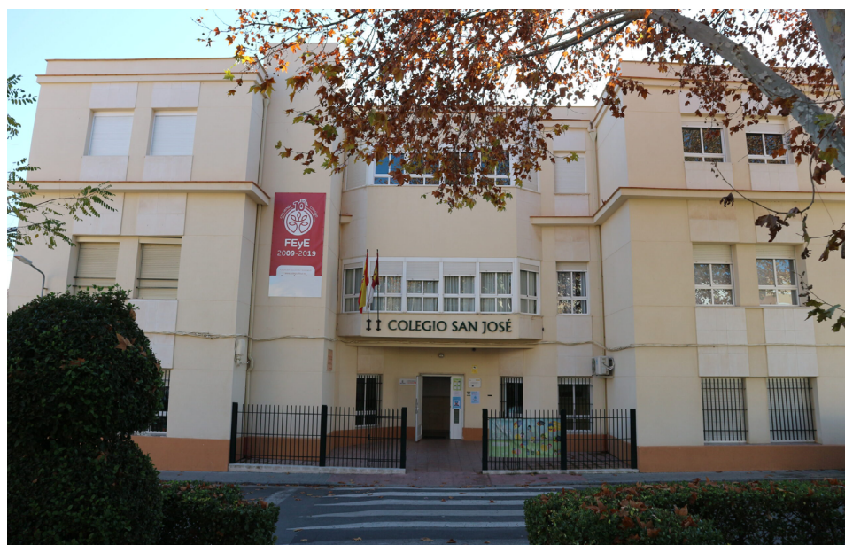
Fachada Colegio San José

El uso de herramientas digitales, como los REA, YouTube, Google Classroom o aplicaciones musicales para móviles ha actualizado y potenciado la metodología tradicional de la clase de música, quedándonos con lo importante: TOCAR, CANTAR y BAILAR, sin perder de vista que el alumnado desarrolle la competencia digital, entre otras.