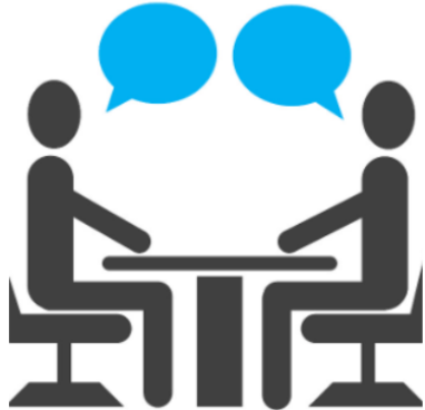
ELKARRIZKETAK / ENTREVISTAS