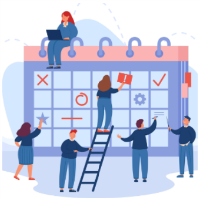
JARDUERAK / ACTIVIDADES