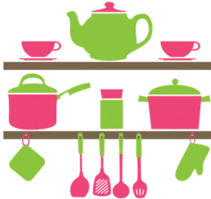
SUKALDARITZA / COCINA