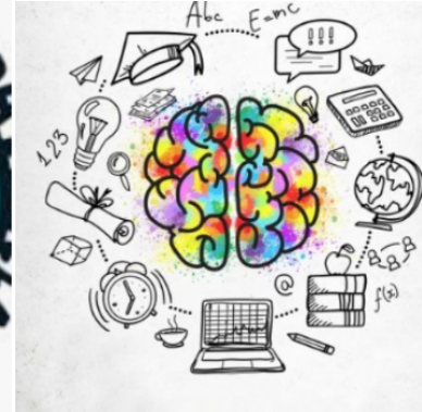
HEZKUNTZA / EDUCACIÓN