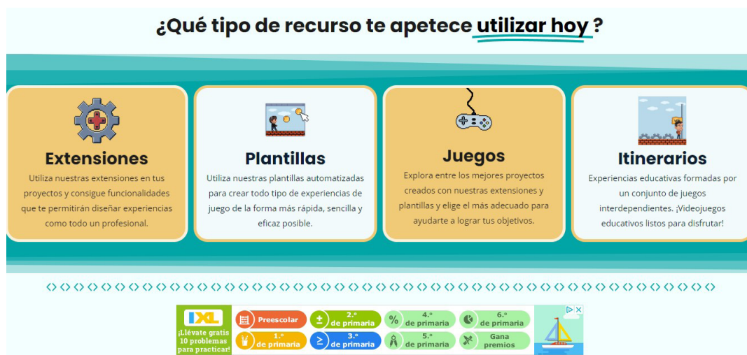
Figura 4. Recursos Genially

Dentro de Genially encontraremos extensiones, juegos, plantillas e itinerarios que nos podrán permitir extensiones, plantillas y otros recursos dentro de esta aplicación, lo que nos facilitará la puesta en práctica en el aula.