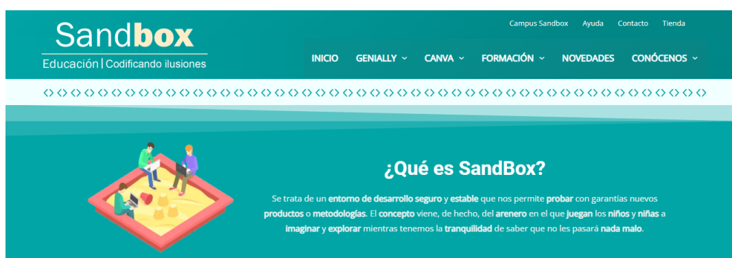
Figura 2. Cabecera de la web Sandbox Educación