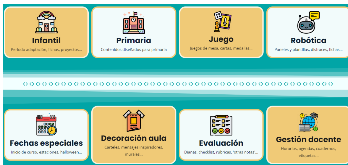
Figura 5. Canva

Dentro de ella, Sandbox Educación nos proporciona una multitud de propuestas. Encontramos diferentes plantillas ya sea para recursos de Infantil, Primaria, para gestión del profesorado, evaluación etc.