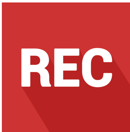
Figura 1. Logotipo de la app

Podcast Spreaker Studio es una aplicación de creación de podcast . Nos ofrece una sencilla interfaz de radio que posibilita, en el ámbito escolar, crear programas de radio de forma fácil y funcional.