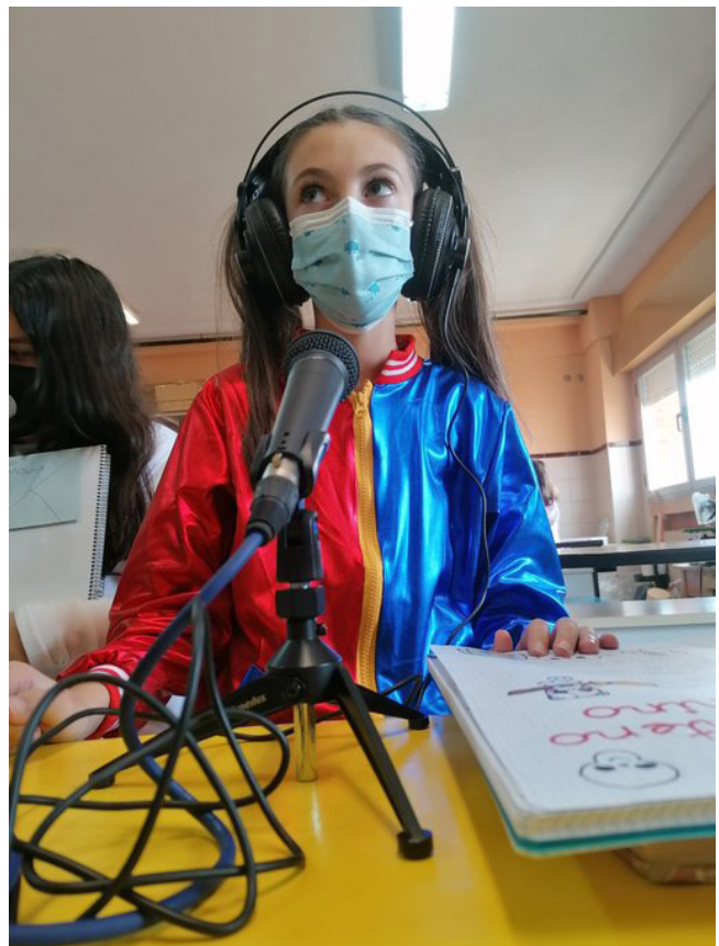
Grabación de "Cosas que nadie quería contarte y hoy sabrás por qué"

Los beneficios que ofrece el uso de Vocaroo están relacionados, sobre todo, con el desarrollo de las habilidades orales. Su potencial para trabajar las competencias lingüísticas es más que evidente, pero también las