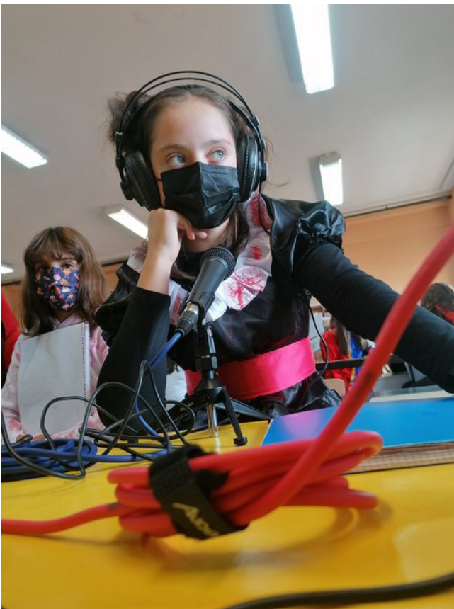
Taller de Jóvenes Escritores con Vocaroo

En este sentido, las posibilidades son tan variadas como la creatividad y la tecnología permiten: desde la grabación de entrevistas o debates hasta su utilización como diario de aprendizaje, donde el alumnado pueda narrar su proceso de aprendizaje y reflexionar sobre el mismo.