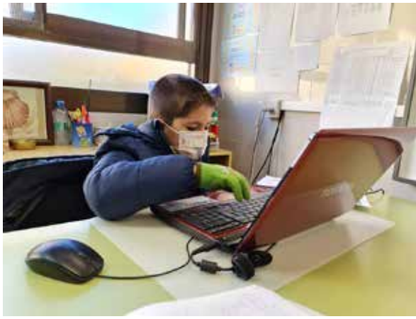
● Alumno elaborando reseña para Valencia Noticias