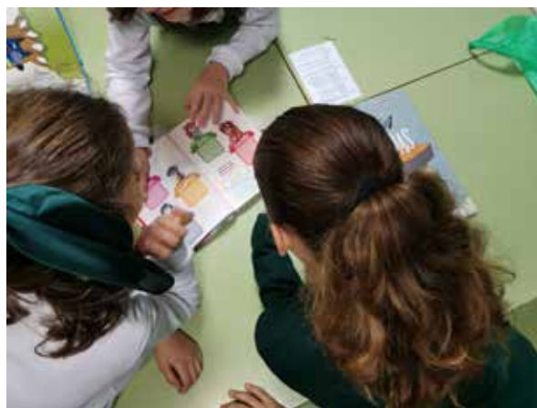
Leemos en clase y en casa

El proceso para la realización de la reseña literaria se divide en cuatro fases :