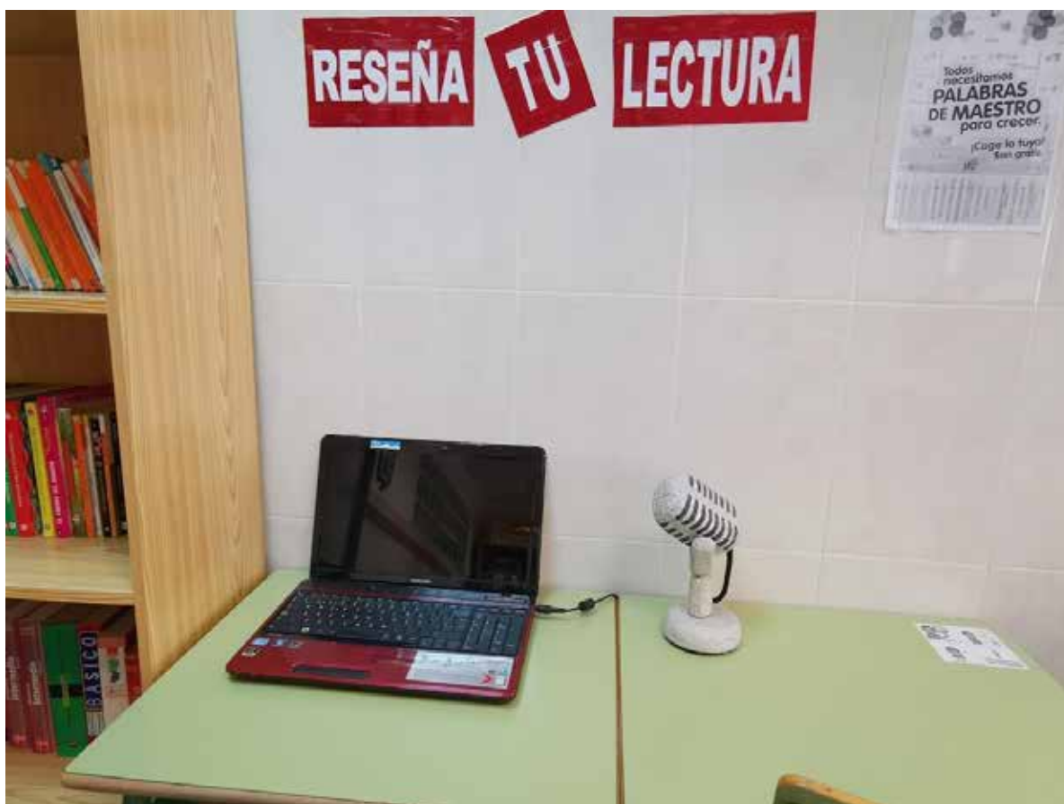
• Zona de elaboración reseñas escritas