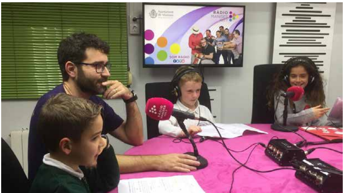
● Participamos en la radio municipal

El proyecto se inició en el curso 2018-2019 y ha ido evolucionando progresivamente. En primer año únicamente se publicaban reseñas en el diario digital Valencia Noticias ( https://valencianoticias.com/ ) lo que generó recibir más reseñas de las que podíamos llegar a publicar. Durante el curso 2019-2020 además de publicarlas en prensa escrita logramos que Radio Manises nos permitiera emitir reseñas radiofónicas. De esta forma logramos duplicar el número de reseñas publicadas semanalmente. El curso 2020-2021 los alumnos y alumnas elaboran un informativo semanal, en formato televisivo, en el que también se ofrecen reseñas literarias. De esta manera cada semana se publican un mínimo de tres reseñas literarias. Durante el curso 2021-2022 seguimos publicando reseñas en prensa digital (una o dos por semana) y reseñas radiofónicas (dos por semana).