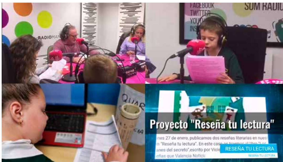
Presentando el proyecto "Reseña tu lectura" en Radio Manises

Este proyecto, basado en el aprendizaje-servicio ha sido premiado en los Premios Grandes Iniciativas 2020, categoría motivación y éxito; y en los Premios Aprendizaje-Servicio 2020, categoría Fomento de la lectura.