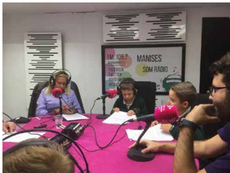
• Llevemos la lectura a los medios de comunicación