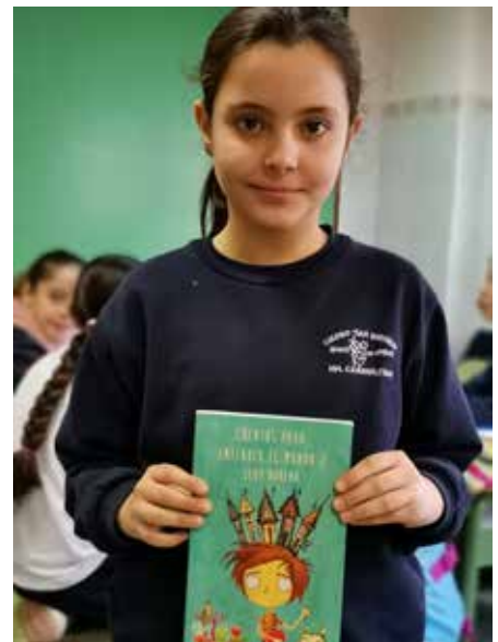
Mejoramos en la lectura