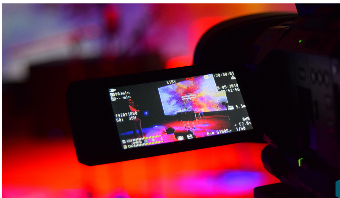
Grabación de videoclip del grupo "Blues Freaks"