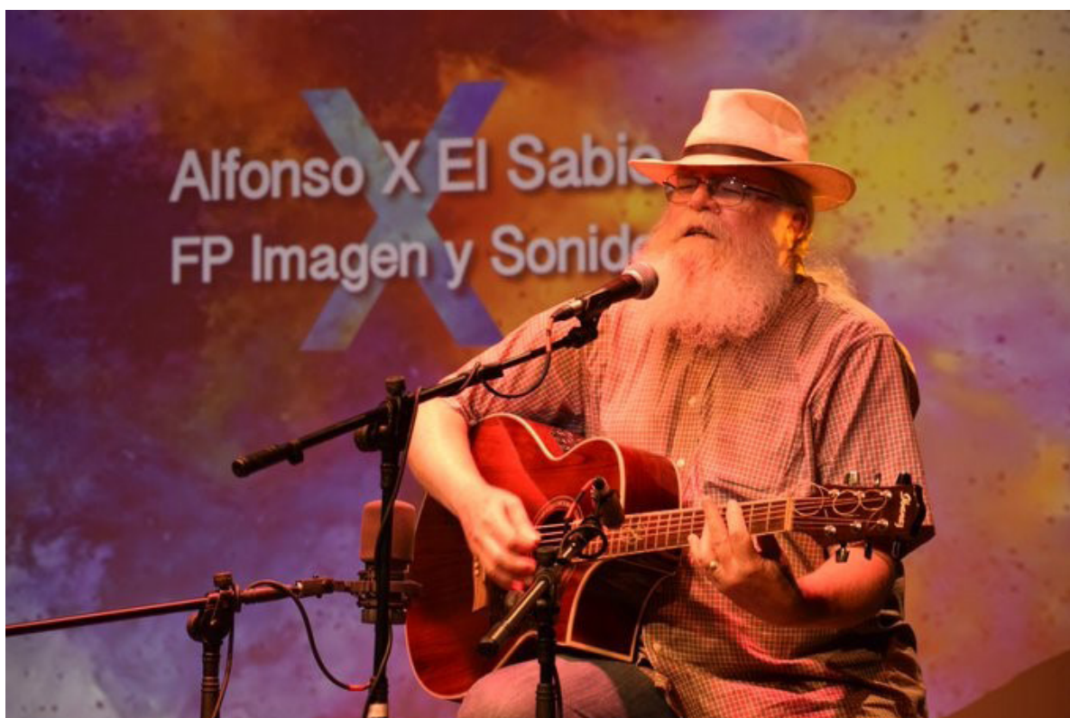
• Celebración de la "Gala musical de clausura"