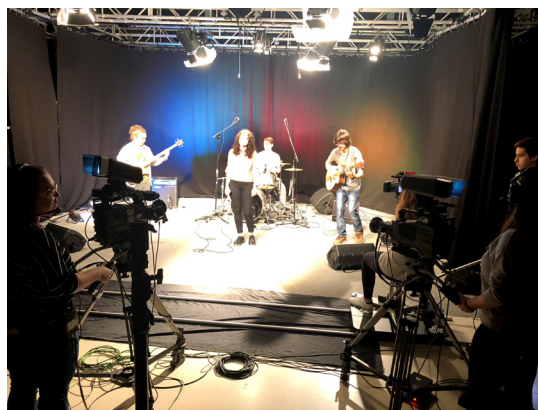
Alumnos y alumnas grabando conciertos en plató

Grabación de concierto en plató de televisión de veinticinco metros cuadrados de superficie a los grupos finalistas, tres en total, realizándose en jornadas diferentes. A cada uno de ellos se le realizó la grabación de tres temas. El sonido fue grabado en directo, sin postproducción posterior. Se utilizaron 5 cámaras y se realizó en directo con equipos Atem de Black Magic . El resultado final se encuentra en el canal de youTube de la familia profesional de Imagen y Sonido.