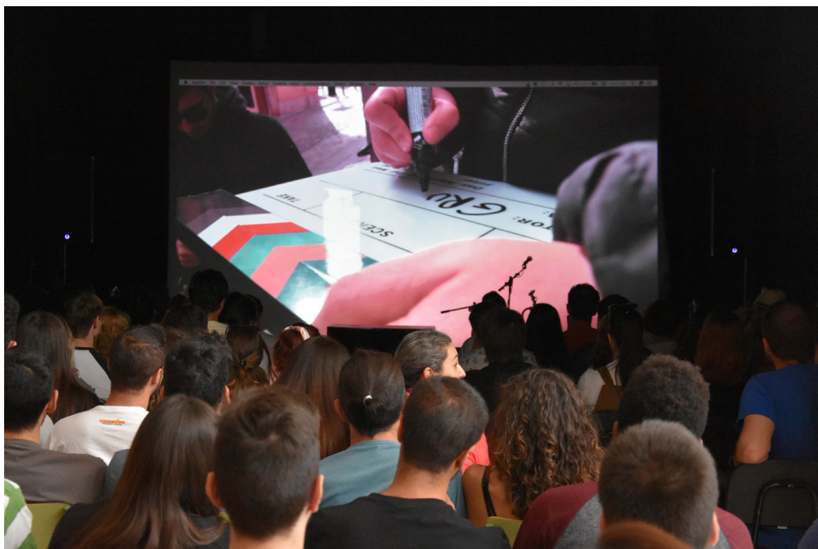
• Retransmisión de la gala musical a cargo del alumnado

El resultado final se encuentra en el canal de YouTube de la familia profesional de Imagen y Sonido