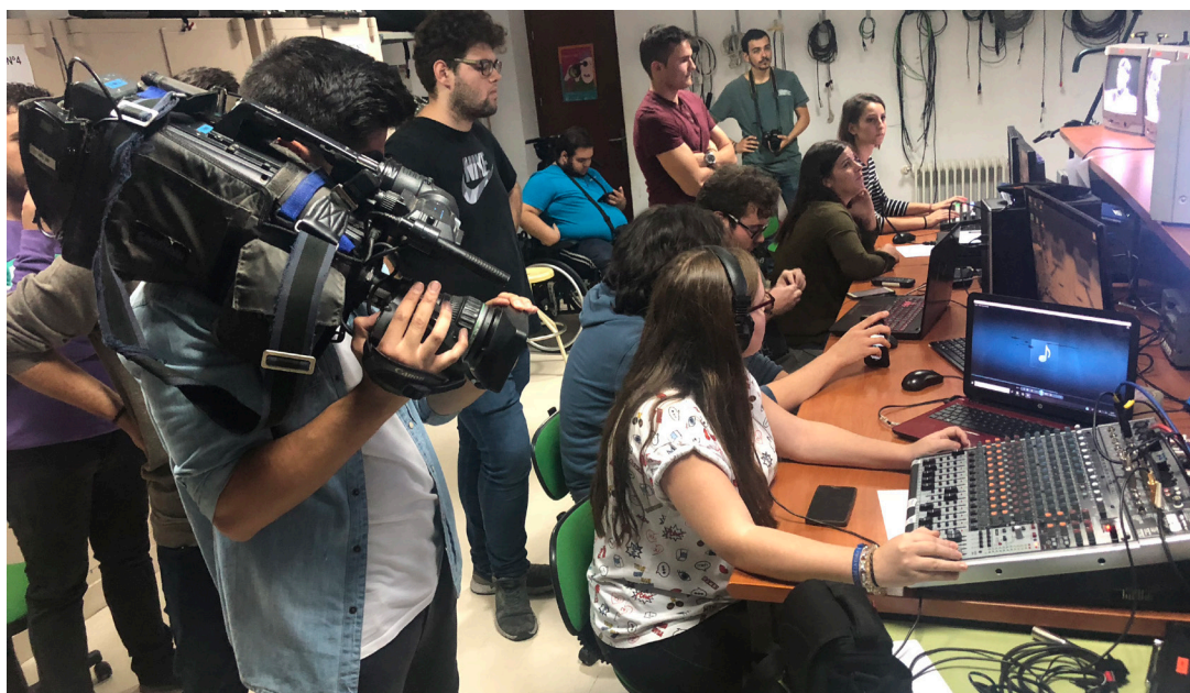
Alumnado en el control de Tv.

Estos proyectos exigen al alumnado un alto grado de coordinación intermodular e interciclos. Otras ventajas de este proyecto es que modifican la práctica docente para ajustarse a un aprendizaje basado en proyectos reales que se plasman en productos audiovisuales de calidad profesional.