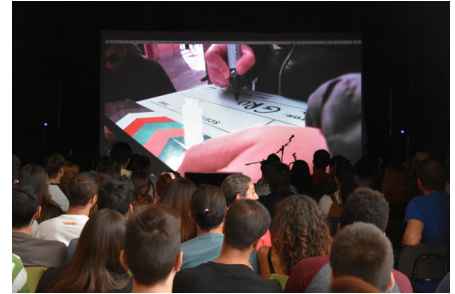
• El alumnado muy atento e involucrado.

Este proyecto de innovación es la evolución de un sistema de Aprendizaje Basado en Proyectos que llevamos realizando desde hace 10 años. Comenzamos realizando pequeñas audiciones, algún videoclip y pequeños eventos en los que colaboraba alumnado de 1.º y 2.º curso de un mismo ciclo formativo. Los resultados han sido tan positivos y la implicación del alumnado era tan motivadora que debíamos dar un paso más para conseguir una experiencia extensiva a la totalidad de los ciclos de la familia de Imagen y Sonido, la comunidad educativa y el entorno social.