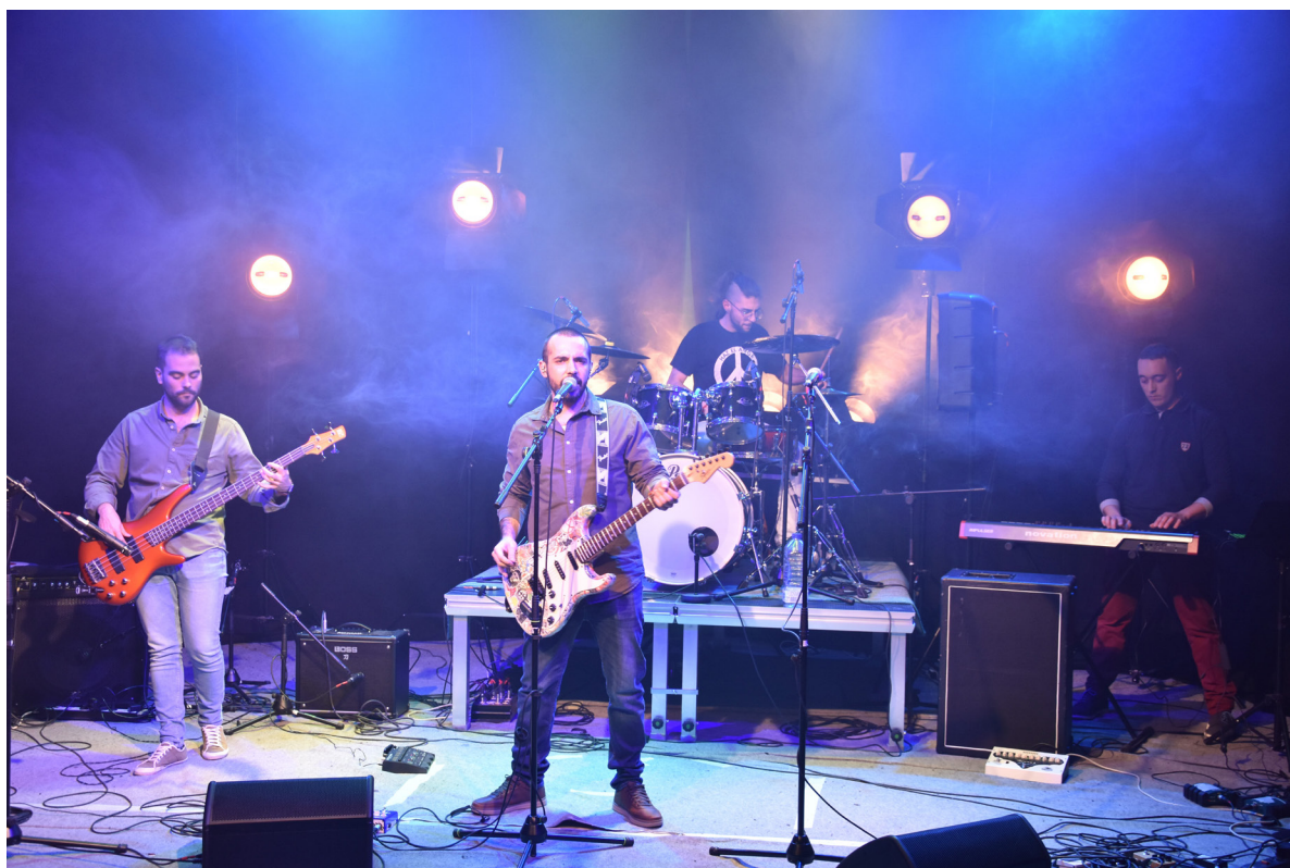
Grabación de videoclip del grupo "Blues Freaks"

Se ha llevado a cabo la grabación del grupo Blues Freak . Para ello ha participado de manera intermódulo e interciclo toda la familia profesional de Imagen y Sonido. Se grabó con un conjunto de cuatro cámaras en diferentes tomas y se editó con la técnica "multicámara" con software Adobe Premiere . La corrección de color se realizó con software Da-Vinci Resolve . El sonido fue grabado y se realizaron los arreglos necesarios en estudio con software Pro Tools de AVID . La iluminación cuenta con esquema básico y de iluminación espectacular.