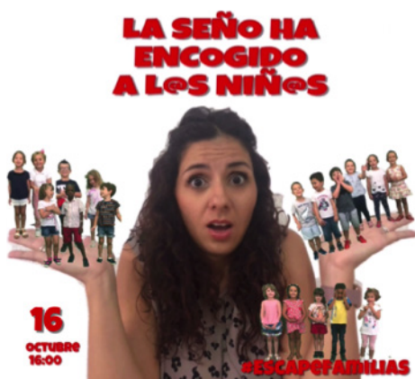
Utilización de capas para cambiar tamaños