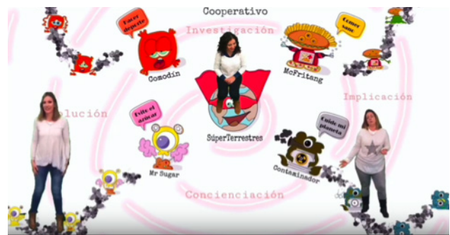
Montaje realizado con Kinemaster