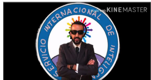
Gamificación con Kinemaster