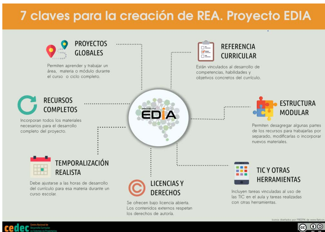
CEDEC. 7 claves para la creación de REA (CC BY-SA)

Esa sería la manera más sencilla de compartir. La más completa, y más efectiva, es subir nuestro REA a un repositorio público como Procomún o EDIA. Así cualquier profesor podrá encontrarlo y usarlo. Quién sabe: tal vez se anime y acabe compartiendo otro Recurso Educativo Abierto hecho con eXeLearning. Creo que ese es el espíritu de este programa.