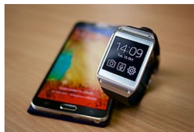
Samsung Galaxy Gear smartwatch, por Kārlis Dambrāns en Flickr, con licencia CC BY 2.0

En un centro de enseñanza secundaria de Wick, en Escocia, se celebró un concurso en el que los alumnos, trabajando en equipos, tenían que diseñar una aplicación para su uso compatible con las Google Glass , el reloj Samsung Gear 2 o el reloj inteligente Pebble .